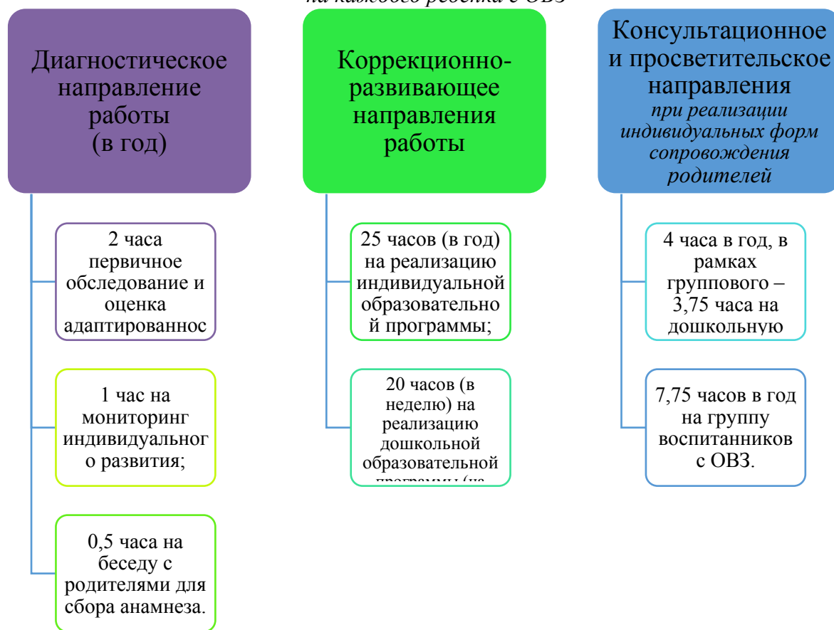
График организации образовательного процесса

В соответствии с письмом Минобрнауки РФ от 24.09.2009 N 06-1216 «О совершенствовании комплексной многопрофильной психолого-педагогической и медико-социально-правовой помощи обучающимся, воспитанникам», на каждого ребенка с ОВЗ